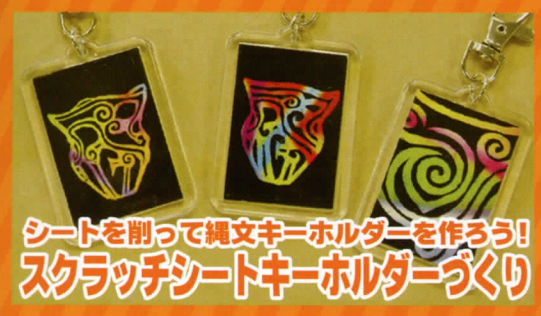
シートを削って縄文キーホルダーを作ろう! スクラッチシートキーホルダーづくり