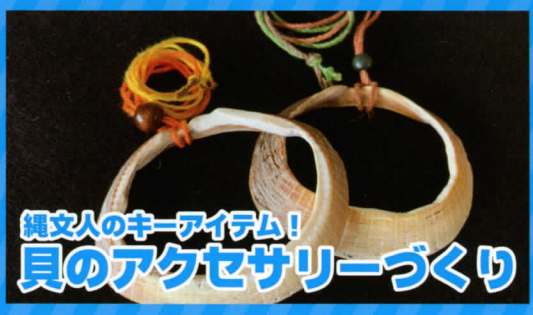
縄文人のキーアイテム! 貝のアクセサリーづくり