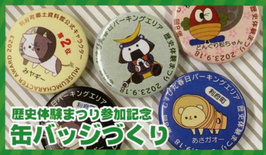
歴史体験まつり参加記念 缶バッジづくり