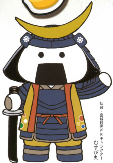
仙台・宮城観光PRキャラクター むすび丸

※一般道(県道仙台松島線)から直接PA内に乗り入れることはできません。三陸自動車道下り線から会場にお越し下さい。なお、通行料金はおお客様のご負担となります。ご了承下さい。