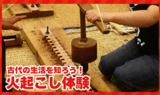
古代の生活を知ろう! 火起こし体験