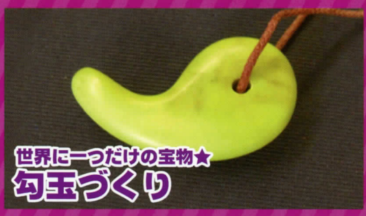
世界に一つだけの宝物★ 勾玉づくり