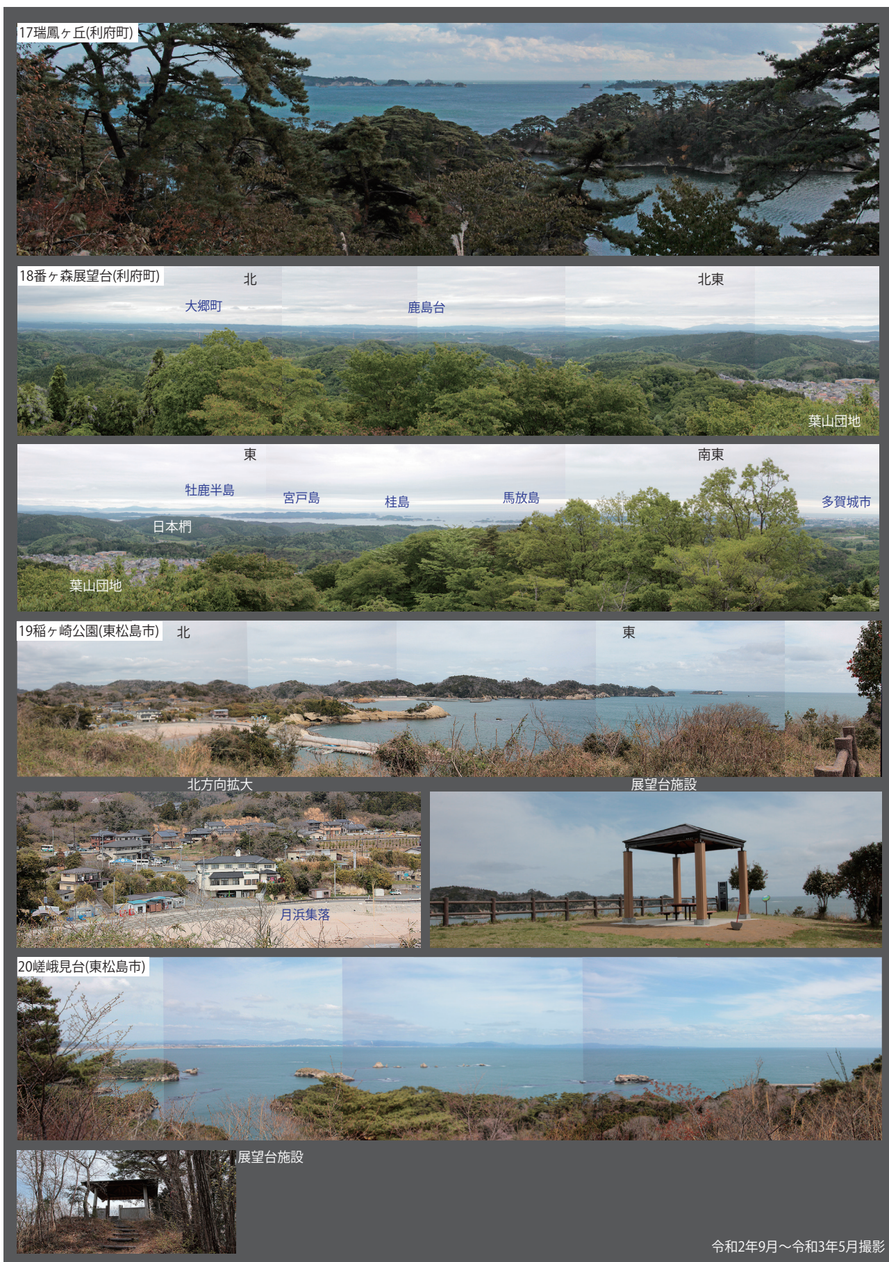
第3-6図 遠景として松島を眺める鑑賞の場(2)