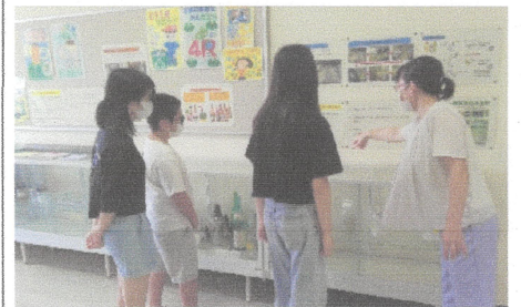
資源ゴミは分別で、生き返る