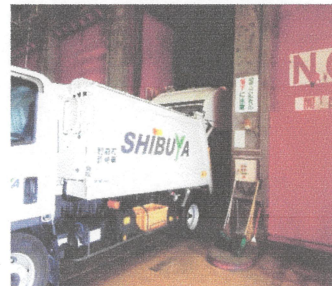
ゴミは利府の清掃工場へ。分別されて活用されるゴミもある