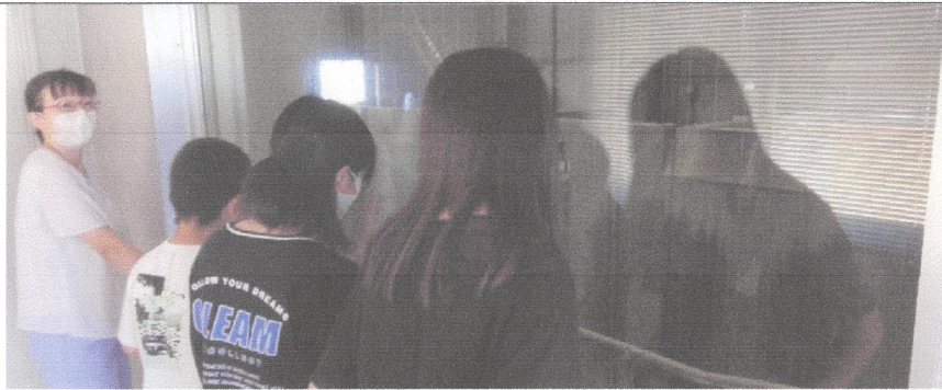
1トンクレーンでゴミを焼却炉へ。一日中、980度でもやす

小学5,6年生の探検隊。なにより、暑い中での収集車、清掃工場の皆さんへの感謝でした(区長)