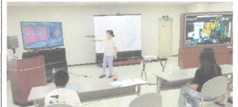
集めたゴミの流れを教えてください