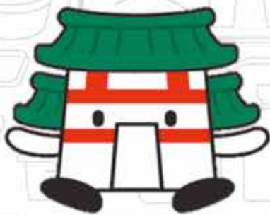
多賀城市観光協会イメージキャラクター