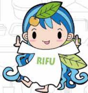
利府町公式キャラクター