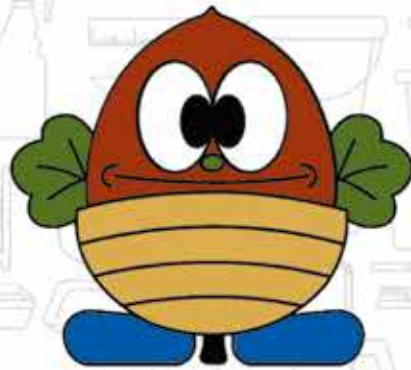
松島町公式キャラクター