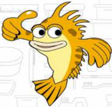
七ヶ浜町観光協会キャラクター