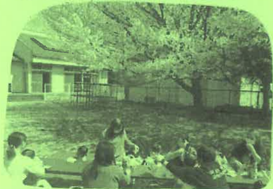
お花見しながら、おやつタイム。ママ達のおしゃべりにも花が咲きましたよ。