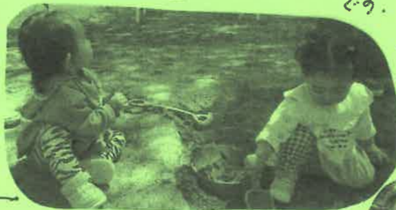
おやつの後、子ども同士で遊ぶ姿も。みんなよく仲良い!! 子どもっていいね!

この度、支援センターから子育てサークルが発足。子どものおとも仲間、ママ達の情報交換の場として、気軽に参加してね。5月は18日(月)11:00~お弁当会食です。(事務所前の申込書に記入してね。) ※英語でダンスの終了後です。