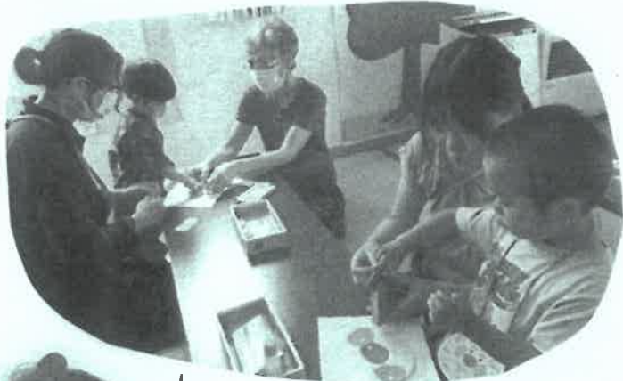
おはみちゃんも参加してくれました。