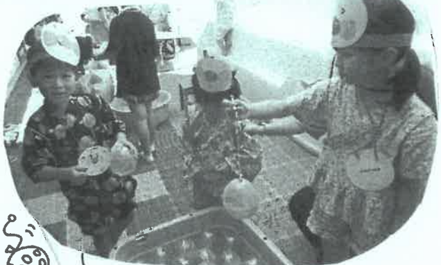
縁日と言えば、水ヨーヨーだね。