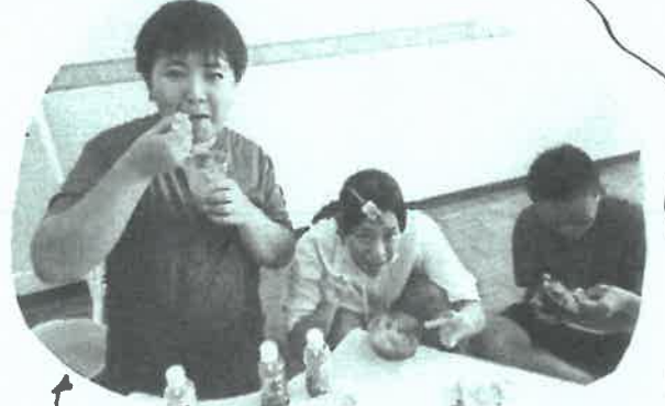
かき氷作りのお手伝いを終え、お姉さん達もひと息!

これからも支援センターが、世代を超えて集える場所でありたいな!と思えた出来事でした。