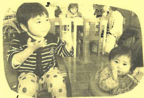
こちらは、おやつタイム。おいしいね。