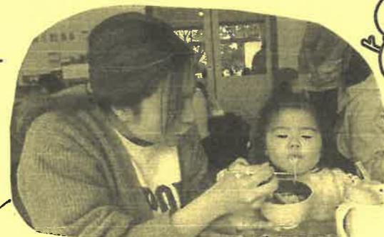
とってもいいお腹が麦面をスルスル