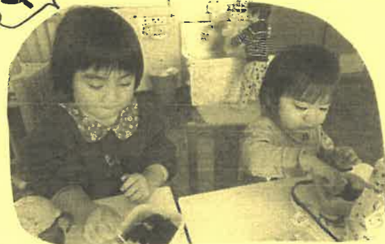
姉妹仲良くランチタイム♡