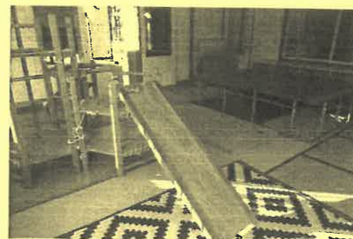
トランポリン、巧技台は運動機能(体幹)や脳の発達を促します。

まつぼっくり広場で、保育士と一緒に健やかな子どもの成長を促し、笑顔の子育てをしましょう。まずは、気軽にご相談ください。お待ちしております。