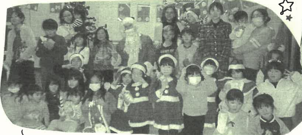
こちらはしちのぶらおのクリスマス会。ママ達がすべて企画し、子どもたちに夢を届けました。