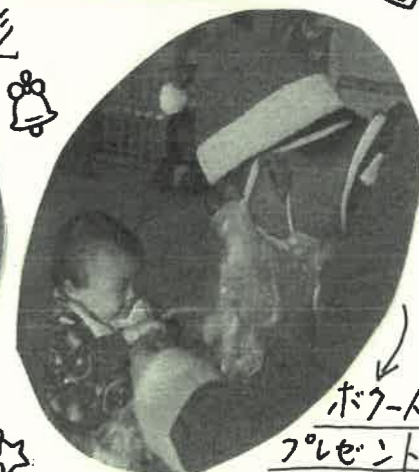
ボクへプレゼントもらったよ!