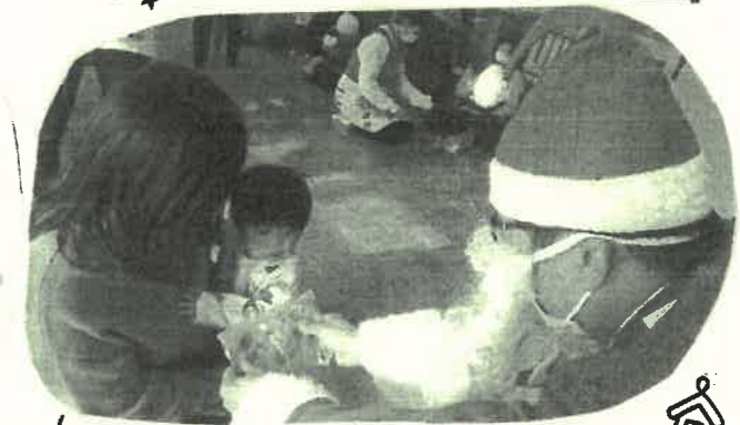
ちびっぴりトキと、身と引いちゃった...