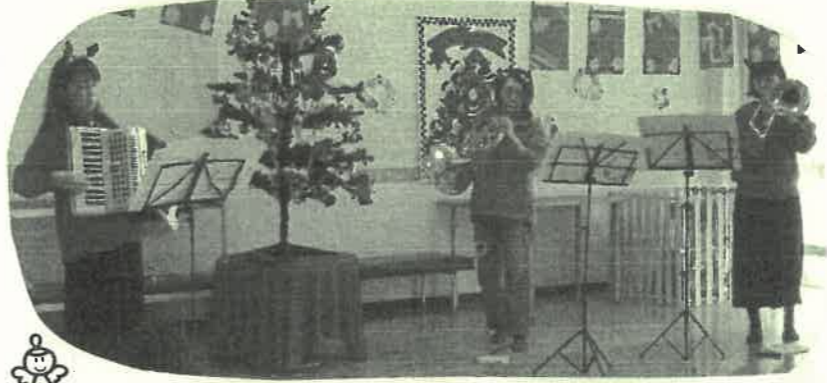
しちのぶらおのみおさんの生演奏は、心にしみました。