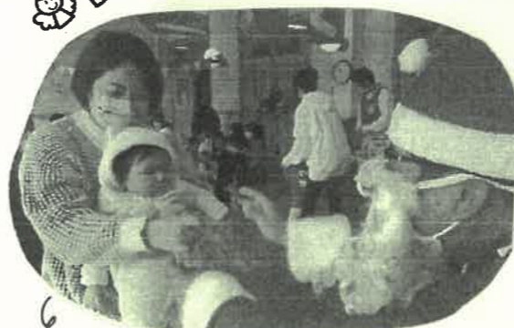
ママの方がニッココ♡