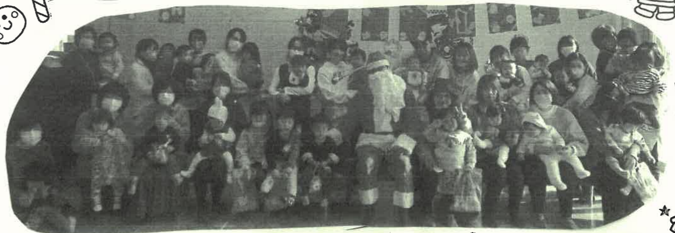
60才(?)のサンタさんと団円で記念撮影