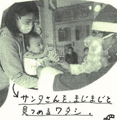
サンタさんとまじまじと見つめるワタシ。