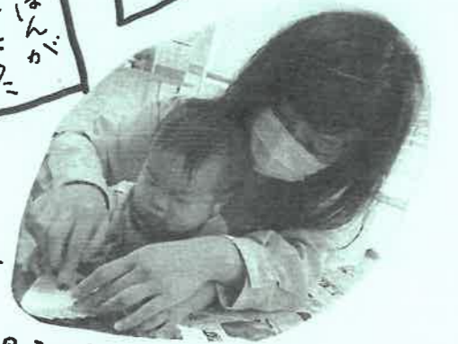
親子一緒にはまりました。

♡ うれしい出来事 ♡ 先日、スウェーデン在住で、帰省中という方からボランティアの申し出があり、暑い中、フェール掃除、畑作業等のご協力をいただきました。おかげで、気持ちよくフェールがオープンできます。暖かい心に感謝です。