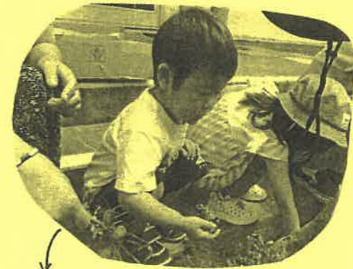
海斗くんでは、カレーに 食べたようです。