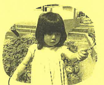
「ワォー、何個もくっ ている!!」