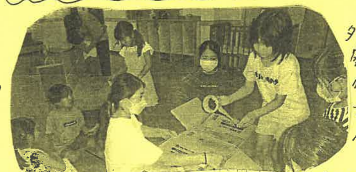
ダンボールなど 廃材を利用し 作ります! ママたちの パワーあじい。

今年は有志によるおみこし担ぎが あります。只今親子でおみこしを製作中 10時30分に登場予定、お楽しみに!!