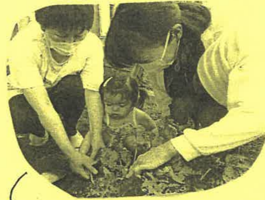
「どこかな〜?」と探すママと れいちゃん

今年は、季節はずれの猛暑で、 例年より早めの収穫となりました。 興味津々で土を堀りおこす親子。 中からあらわれるじゃがいもの発見に 大喜びでした。 持ち帰ったじゃがいもは、どんな 料理になったのかな?!