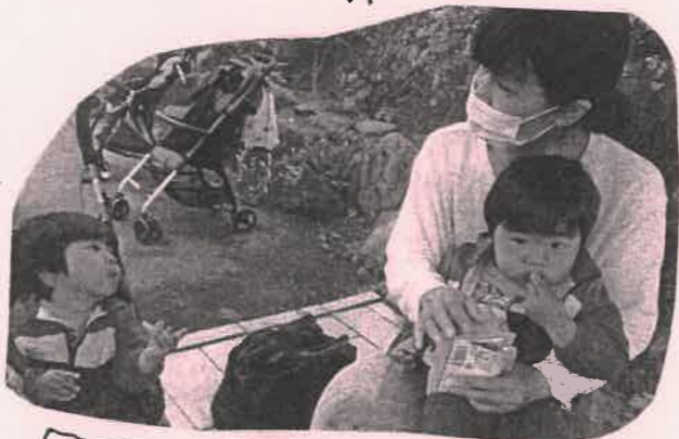
買ったお菓子で、おやつタイム。 子どももママもニコリエ