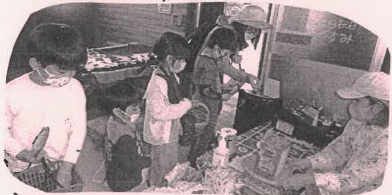
小学生チームは、自分で考えお買物 もちろん。会計も自分で。さすがです。