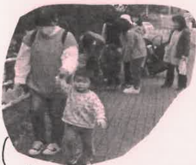
最近、男と一緒にお散歩してきましたよ。

これからもこの場所が、遊びの場、交流の場、そして育ちの場として、親子の支援ができるとうれしいです。みなさん、今後とも、よろしくお願いします。