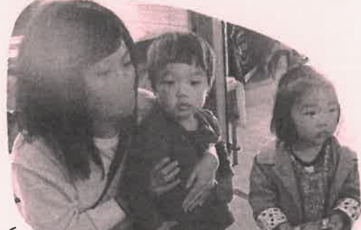
馬犬菓子やさんにも行ったね。