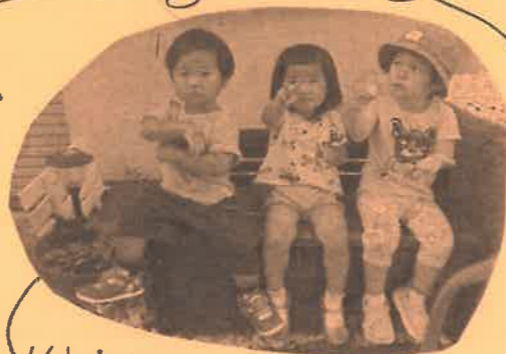
住宅街のイスとお借りし、 ひと休み♡

道端で、どんぐり拾い。 拾うのも楽しいけど、 どんぐりの皮むきに 夢中になぶ子も... 子どもの世界、 楽しいよ♡