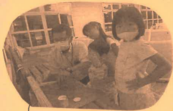
所長先生におしえてもらい 挑戦