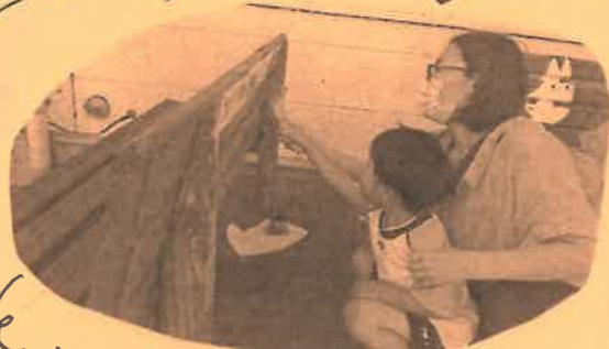
親子で協力して、ペンキ塗り

所長先生と子どもたち、そしてママ も参加し、ペンキ塗り。 今、流行のDIYです。