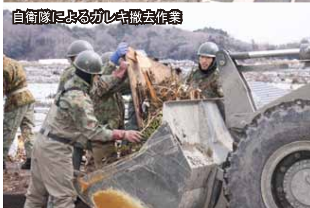
自衛隊によるガレキ撤去作業