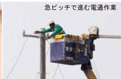
急ピッチで進む電通作業