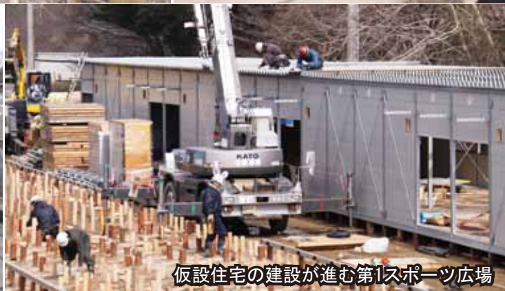
仮設住宅の建設が進む第1スポーツ広場