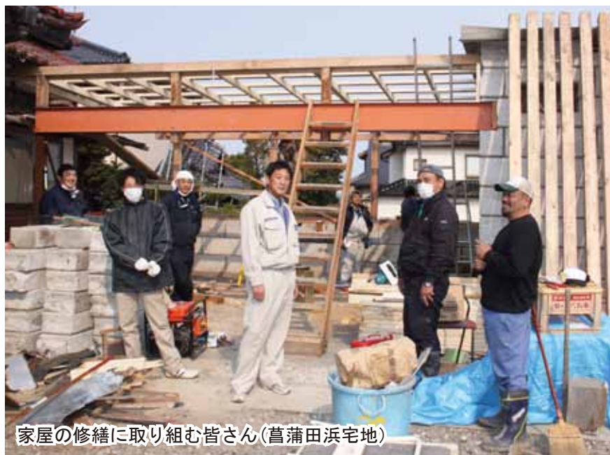
家屋の修繕に取り組む皆さん(菖蒲田浜宅地)