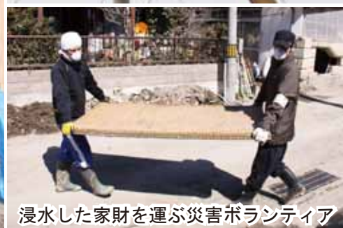
浸水した家財を運ぶ災害ボランティア