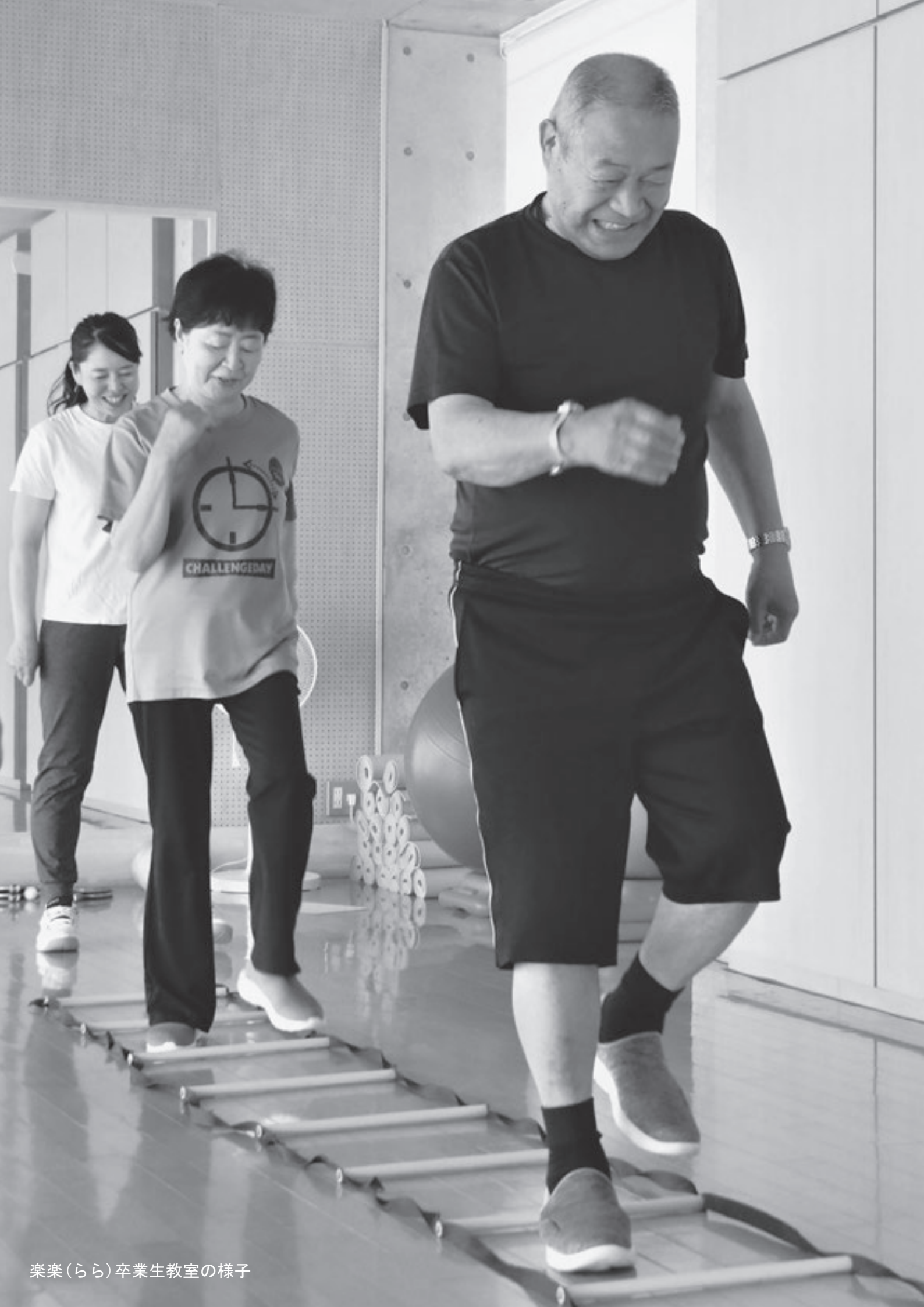
楽楽(らら)卒業生教室の様子