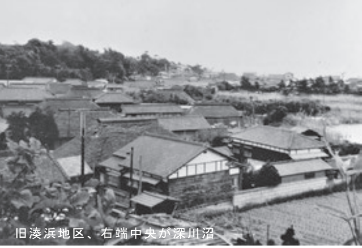
旧湊浜地区、右端中央が深川沼