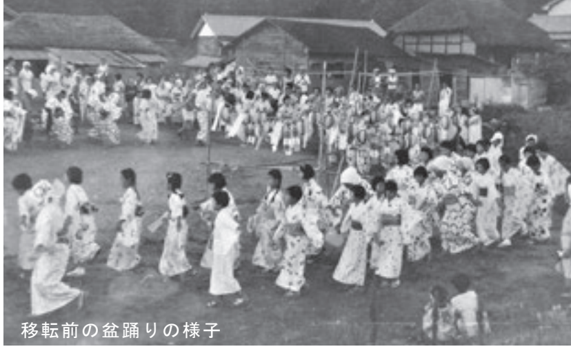
移転前の盆踊りの様子