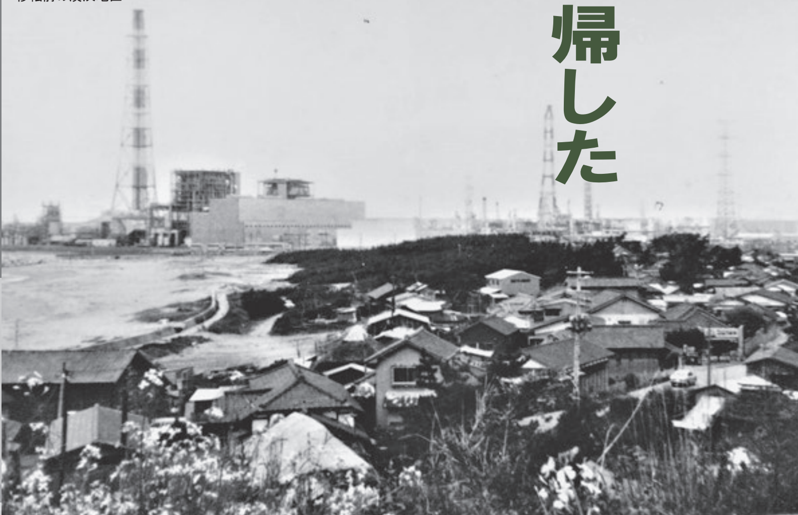
移転前の湊浜地区

岸柳 女の人はお手玉したり、ケンケンパーしたり、ゴム張って飛びっこしたり、よくやったさ。私は、高く飛ばうとして地面に胸を