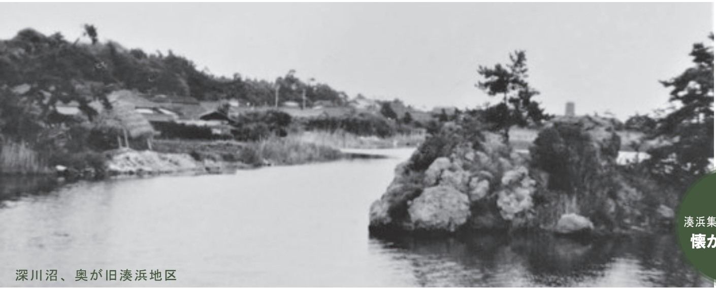
深川沼、奥が旧湊浜地区