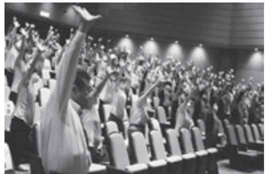
昨年のわくわくシニアフェスティバルの様子