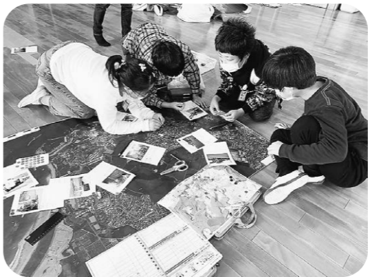
いざというときのために

答 防災カリキュラムでの講義だけでなく、システムの活用や各校の防災対策事例の紹介、意見交換会、研修会などの交流をしている。また、町内にも安全担当主幹教諭が三人いて、毎月の主幹教務主任会議など、情報交換を行っている。防災主任などが研修してきた情報や事例は、校内の先生方に共有されている。