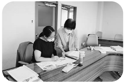
町民の皆さんに伝わる記事づくりを