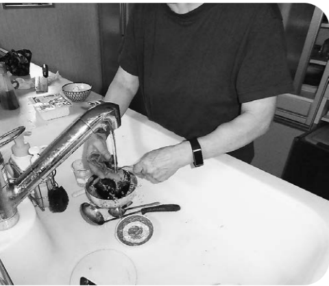
すべての世帯、事業者に経済支援の恩恵を

問 菖蒲田海水浴期間は広場利用者も有料の根拠は、 答 町長 海水浴場実行委員会、広場利用者とは判別が困難のため、徴収していた。