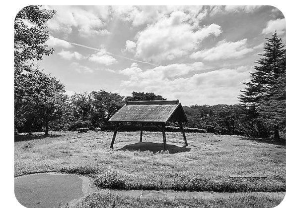
利用者のニーズに応えられる施設へ (野外活動センター相撲場)

答 スポーツ施設の指定管理者であるNPO法人アクアゆめクラブでは、スポーツ利用者へのアンケート調査を実施している。今後も、このアンケート調査を参考に、施設の改修、それから改善に努めていきたい。施設利用者の声を大切に、よりよい施設運営を行っていきたく考えている。