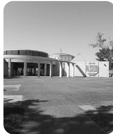
みんなに愛され30周年