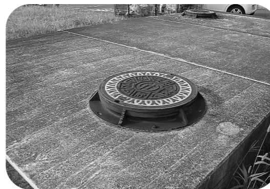
いつでも使えるように

答 防災対策室長 東部タウン児童公園内のもので、木が立っており縁石もあるなど、危険との声があったことから支障物を撤去した。点検は、定期的ではないが、消防団や消防署も入れて実施している。