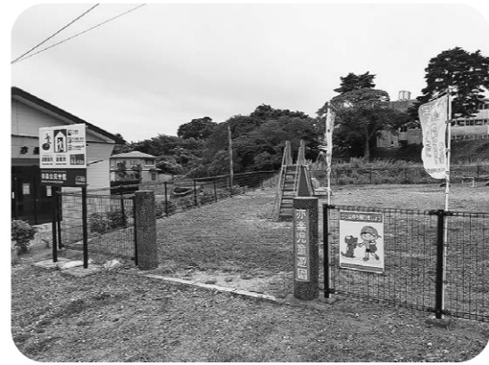
子どもの楽しい遊び場

問 各地区は年何回、公園等の維持管理に協力しているのか。また、支払いの回数は。 答 建設課長 協力していただいている回数はその地区や公園によって異なる。また、支払いの回数は年1回の支払いである。