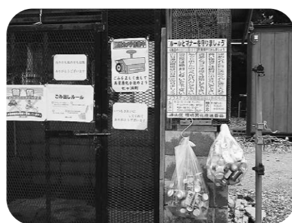
ごみ減量に取り組もう

問 リサイクル量はごみ減量化を考えると多くなるべきであるが逆に減っているのはなぜか。