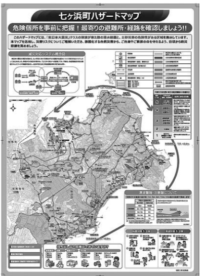
日頃から避難路を確認しましょう

問 町内外の外国人に対する避難対応は、 答 町長 避難誘導看板は英語表記されている。観光ガイドブックも含めQRコードの表示を進め、当面はQRコードから町ホームページにアクセスしていただくことを考えている。ハザードマップの英語版も考えている。