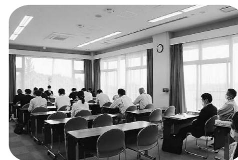
研修を受けてサービス向上へ