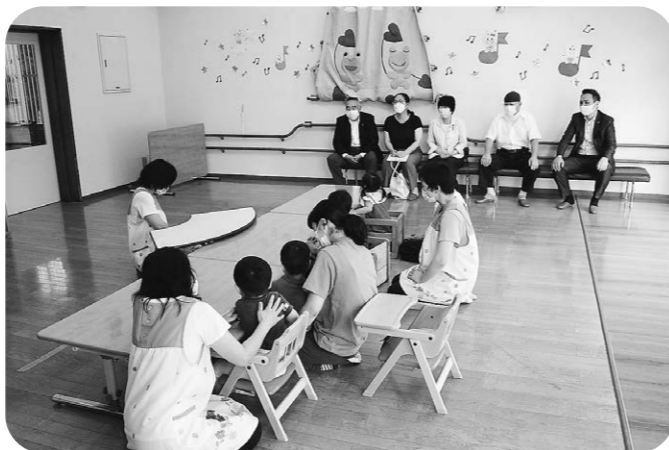
みんな仲良く楽しそう