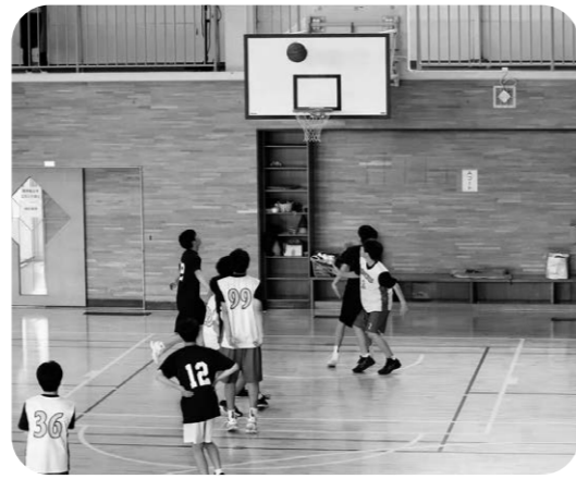
のびのび運動したいな