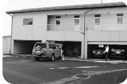
修繕が必要な庁舎施設