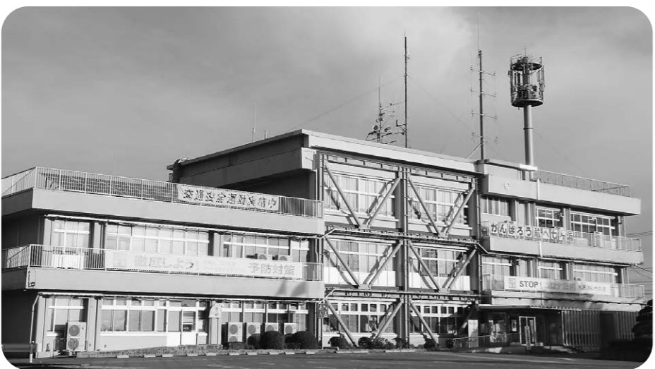
公会計での管理は?(役場庁舎)

問 対象である公園の種類と数、報奨の交付対象は。 答 町長 対象の公園は、児童遊園11カ所および児童公園39カ所である。また、報奨の交付対象は、年間を通して雑草の抜き取りや刈り込み、公園内の清掃に関するなどの活動をおおむね実施していると認められる業績に対して行うものである。