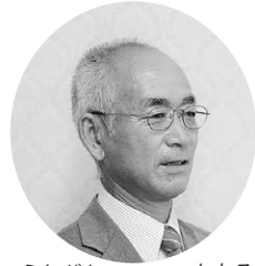
うたがわ わたる 歌川 渡