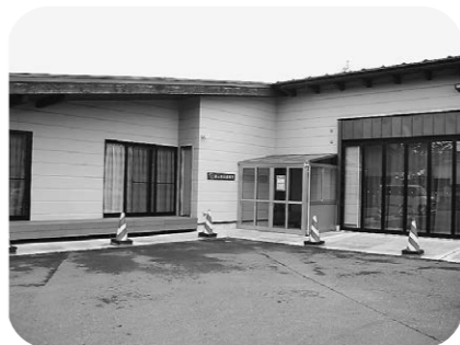
避難と安否確認は声かけあつて

答 長寿社会課長 区長や自主防災会会長、民生委員、社会福祉協議会である。名簿は見守り活動や発災時の安否確認に使用してほしいとしているため、指導はしていない。