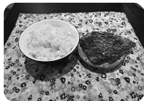
まちの名産を給食に

答 教育長 いろいろ考えて、生産者にあたってみたが、食材の納入の仕組みが合わないことや一定数の納入が難しく活用できていない。