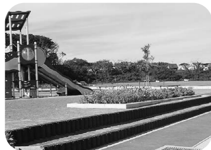
砂の流出の心配が解消

答 建設課長 雨が降ると管理棟の方へ砂が流れて来るため、階段やアスファルトで、勾配をなくす工事である。