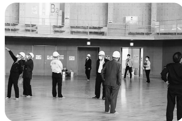
町民みんなが待ち望んでいる

答 財政課長 入札の条件付き一般競争入札で行い、あらかじめ提出された総合評定表で、建築一式工事にかかる総合評定値が1200点以上のAランクの業者ということで条件をつけている。