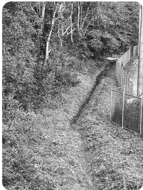
この水路の奥を水質検査します(東宮浜字北下方)

答 建設課長 アクアアリーナから代ヶ崎浜方面に向かう途中の、縦断線のり面工事である。のり面の表土が落ちているので、表土の土砂の掘削や清掃を行い、周りの草を除去してからモルタル吹付となる。工期は冬ごろをめどに考えている。