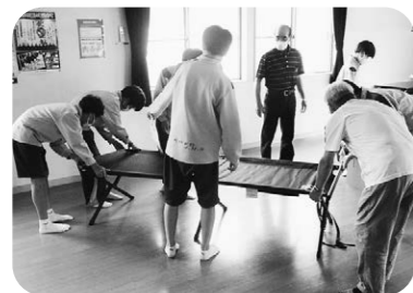
災害に備えて僕たちも訓練

契約先 株式会社共栄防災 契約額 1014万円 納入期限 令和4年12月26日 採決の結果 反対なく全会致で可決