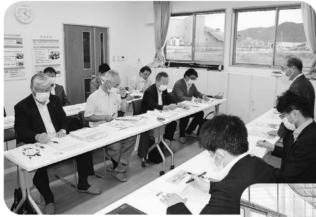
くみに農業ビジネス訓練所にて

6月27日、持続可能な農業を目指している福島県国見町を視察しました。現在、国見町の農業の現状は、専業農家203戸、兼業農家706戸。広大な面積の農地となっており、国見町で実施予定の各種農業施策の一部について次の通りです。 ①「遊休農地解消策について」は、農地中間管理機構と連携し、担い手である認定農業者に対し、遊休農地再生事業や荒廃農地解消のための助成金などを検討。 ②「農地利用集積について」は、約500ヘクタール