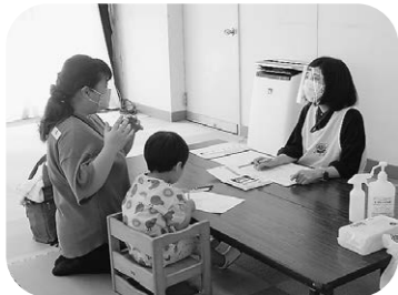
なんでも相談してね (3歳児健診にて)

答 子ども未来課長 母子手帳交付を子育て支援センターで行うなど、子育てにつながるようしている。交付する際には状況を聞きながら相談内容によって、要支援や特定妊婦としての支援を行うなど、継続的支援につなげている。