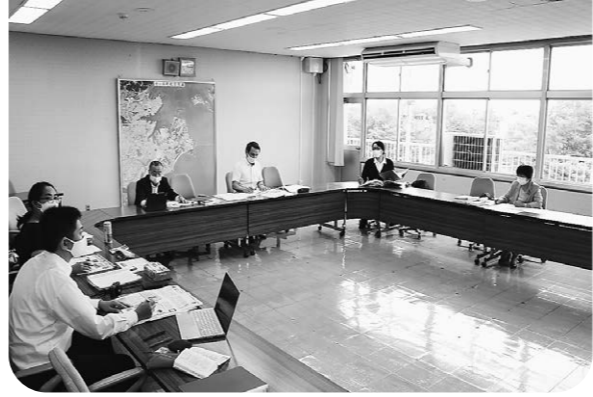
原稿を委員全員でしっかりチェック

広報広聴常任委員会の広報分科会では、記事原稿や表紙写真はもとより、記事にするための文字起こし(反訳)や構成、レイ