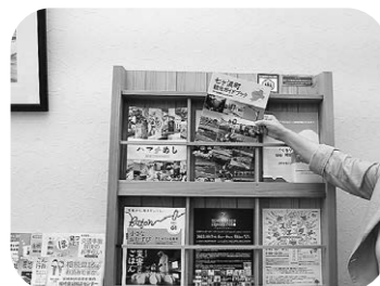
配置場所が増えました

答 産業課係長 改訂は行っている。配置は利府春日パーキングエリアや東京の宮城ふるさとプラザ、JR東日本四ツ谷駅などである。