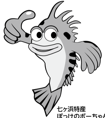
七ヶ浜特産 ぼっけのポーちゃん