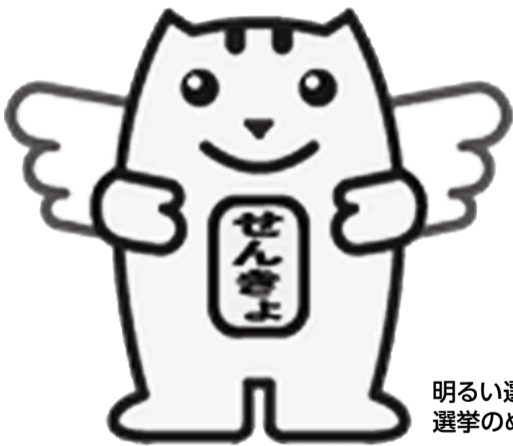
明るい選挙キャラクター 選挙のめいすいくん