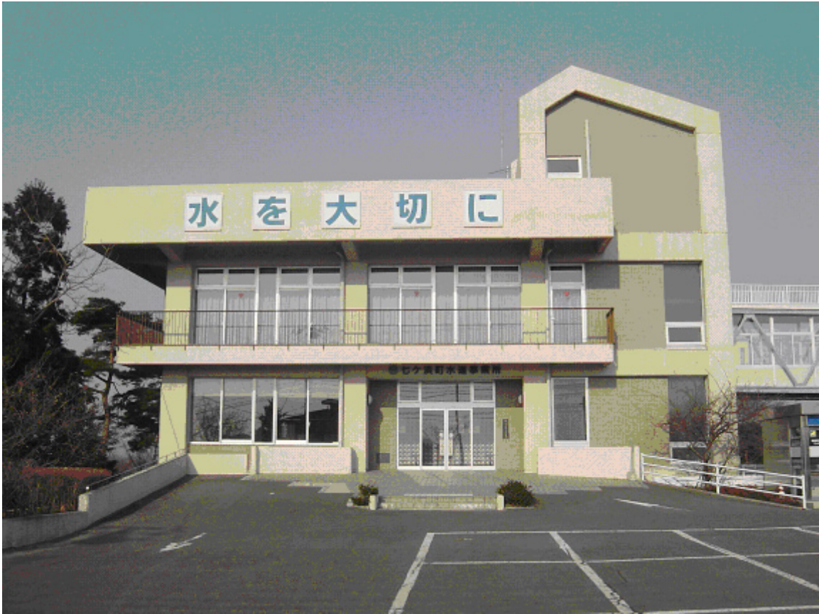
七ヶ浜町水道事業所